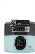
パーフェクトグラフト・消臭 空間用ゲル