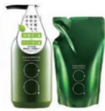
cureamino(キュアミノ) リバイタライズコンディショナー