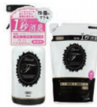
fabrush消臭スプレー (衣類・布用)