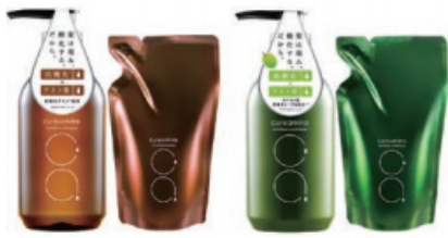
cureamino(キュアミノ) リバイタライズシャンプー